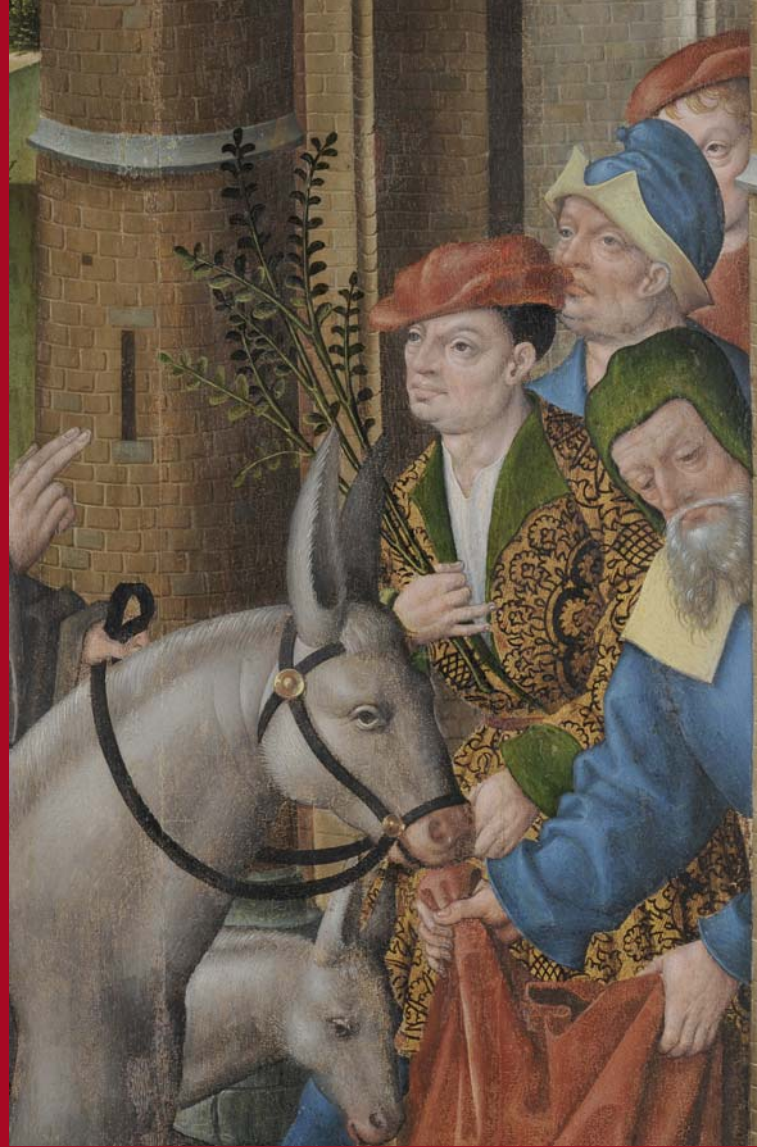
Ausschnitt aus der restaurierten Tafel 9, Einzug in Jerusalem